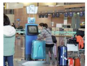
공항 수하물 저울 설치 사례